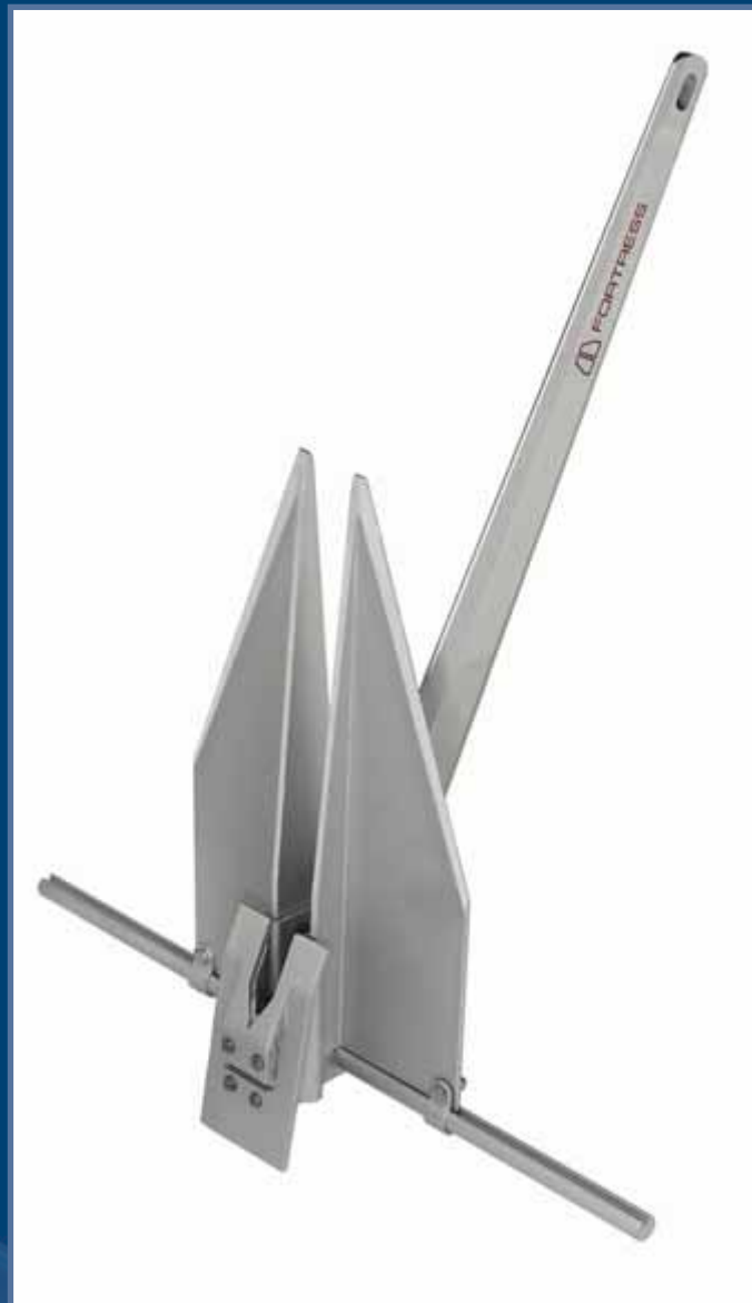
Fortress Aluminium Anker